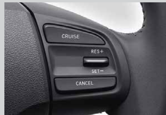
Điều khiển hành trình