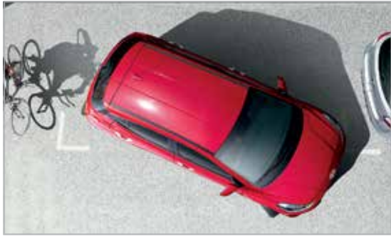
Cảm biến va chạm phía sau