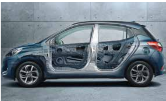
Hệ thống khung mới cứng vững hơn với thép cường độ cao AHSS