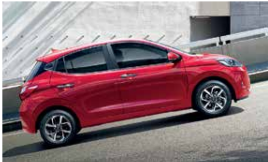
Hệ thống hỗ trợ khởi hành ngang dốc tích hợp với cân bằng điện tử