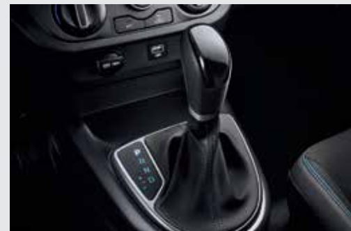
Hộp số tự động 4 cấp

Mang đến khả năng vận hành bền bỉ và tiết kiệm nhiên liệu