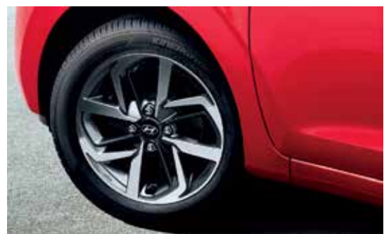
Hệ thống cảm biến áp suất lốp