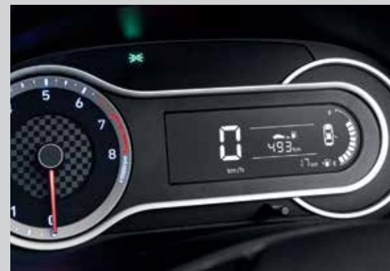
Màn hình thông tin thiết kế thể thao