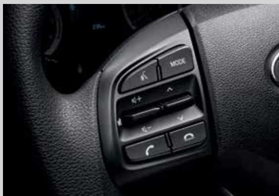
Cụm điều chỉnh media tích hợp nhận diện giọng nói