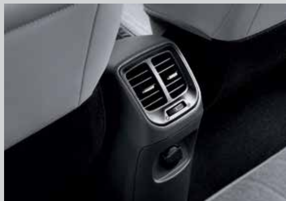
Cửa gió điều hòa hàng ghế thứ 2