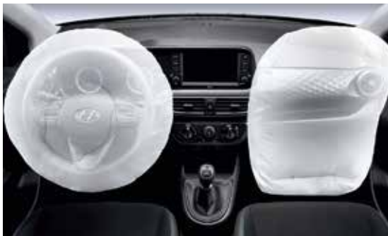
Hệ thống an toàn 2 túi khí