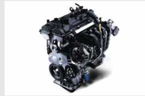
Động cơ Kappa 1.2L mang đến khả năng vận hành êm ái, ổn định cùng với khả năng tiết kiệm nhiên liệu nhưng vẫn đáp ứng được nhu cầu vận hành của khách hàng.