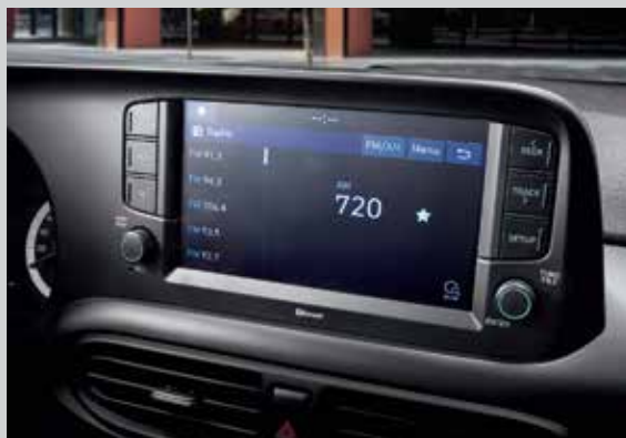
Màn hình giải trí 8 inch