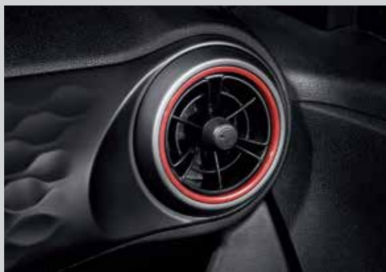
Cửa gió điều hòa dạng tua bin với 2 tông màu trẻ trung