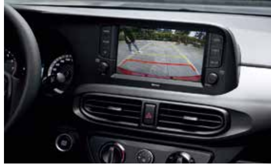
Camera lùi hỗ trợ đỗ xe