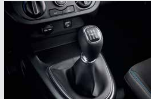
Hộp số sàn 5 cấp

Mang đến khả năng vận hành bền bỉ và tiết kiệm nhiên liệu