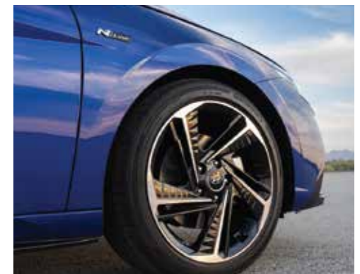
Vành hợp kim 18 inch 2 tone màu (Phiên bản N Line)