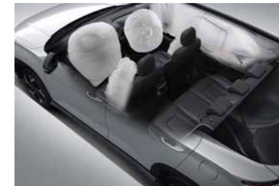
6 túi khí