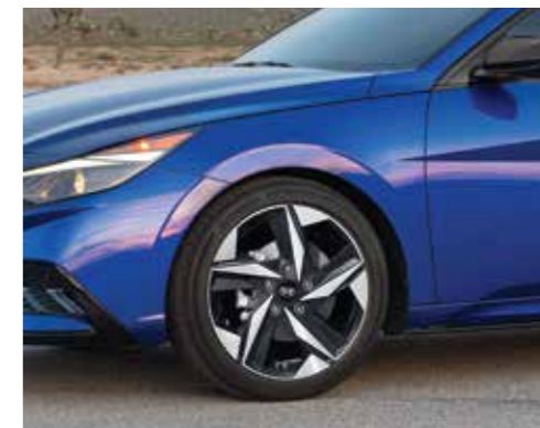
Vành hợp kim 17 inch 2 tone màu (Phiên bản 2.0 AT)