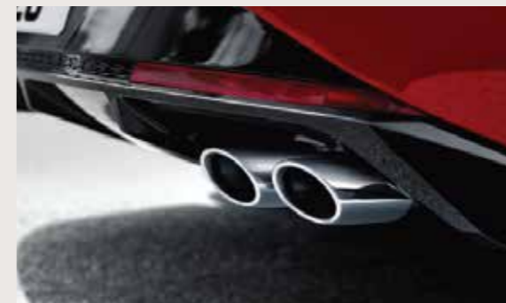
Chụp ống xả kép thể thao