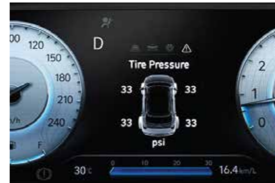
Hệ thống cảm biến áp suất lốp

Elantra hoàn toàn mới được trang bị khung gầm hoàn toàn mới để đảm bảo sự chắc chắn đi cùng hệ thống an toàn. Bên cạnh đó, động cơ Smartstream 1.6 T-GDi mới giúp Elantra trở thành chiếc xe mạnh mẽ nhất phân khúc