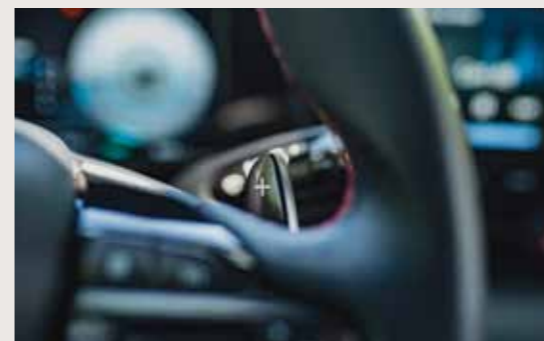
Lẫy chuyển số sau vô lăng