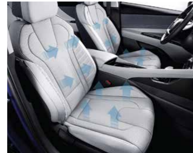
Sưởi và làm mát ghế