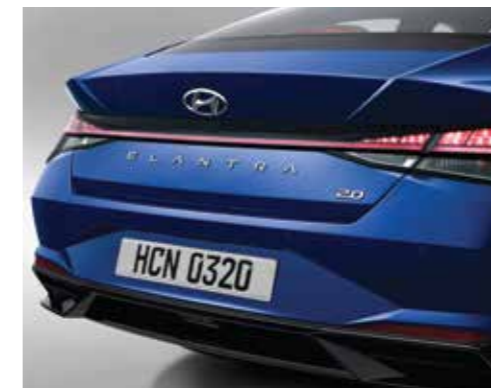
Cụm đèn hậu dạng LED (Phiên bản 1.6 AT/2.0 AT/N Line)