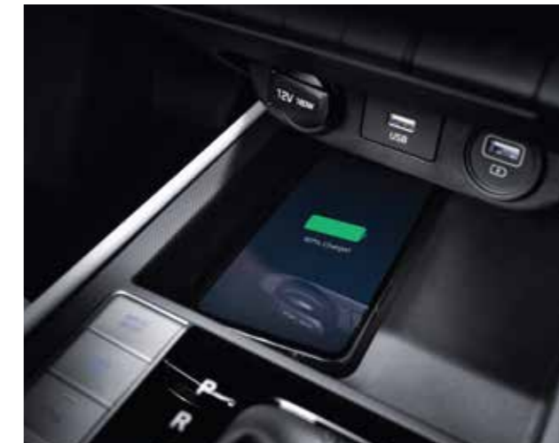
Sạc không dây