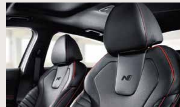
Ghế da thể thao N Line