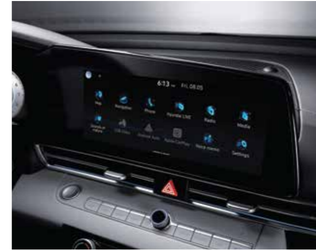
Màn hình giải trí 10.25 inch

Với các đường nét đơn giản nhưng đầy tính thể thao gợi cảm, All New Elantra mang đến một không gian nội thất hài hòa cùng không khí thể thao tràn ngập trong khoang lái