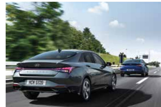
Điều khiển hành trình