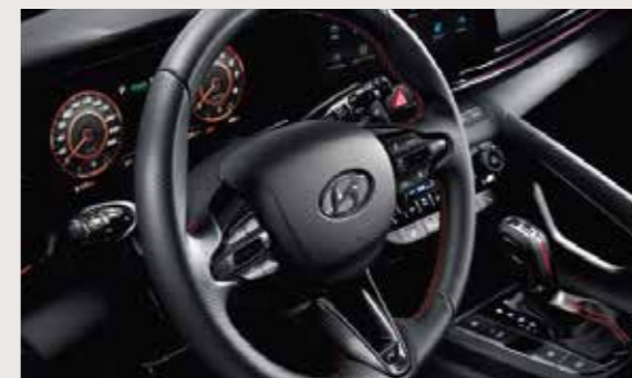
Vô lăng 3 chấu thù chỉ đỏ