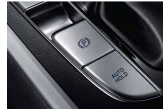
Phanh tay điện tử