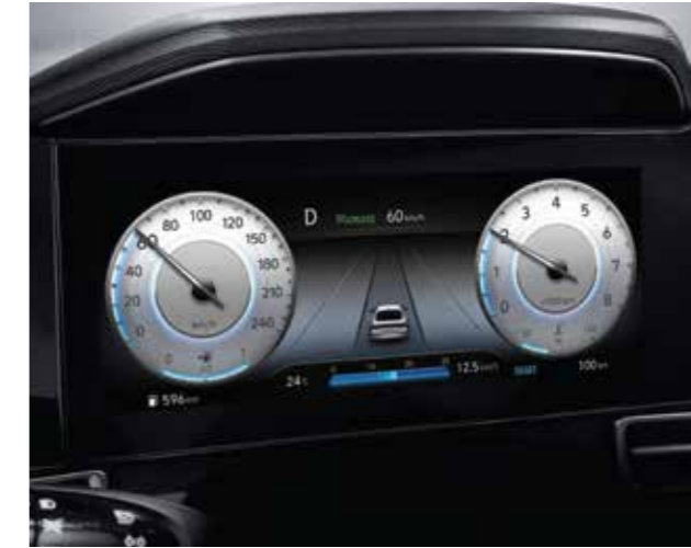
Màn hình thông tin digital 10.25 inch