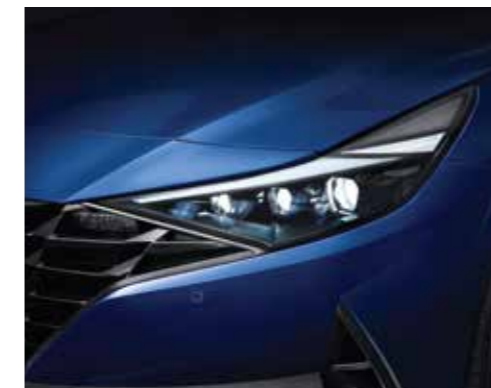
Đèn chiếu sáng LED (Phiên bản 1.6 AT/2.0 AT/N Line)

Thiết kế khác biệt với phần lưới tản nhiệt “Parametric Dynamics” tạo thiết kế mạnh mẽ, góc cạnh, thể thao cho Elantra