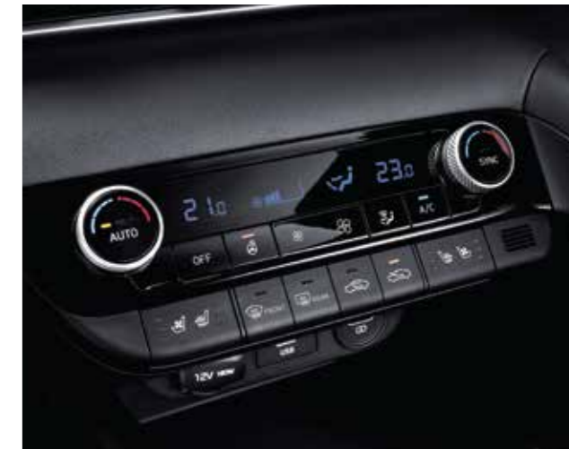
Điều hòa tự động