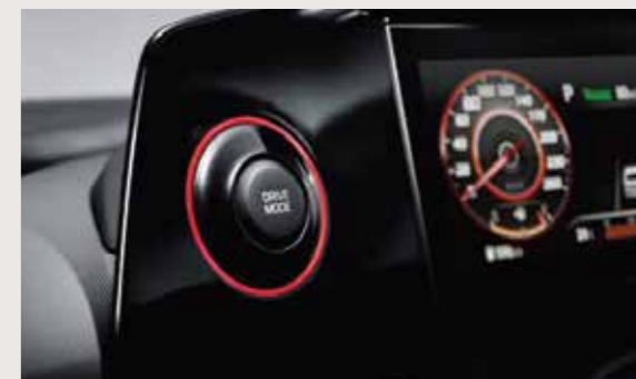
Nút bấm chuyển chế độ lái