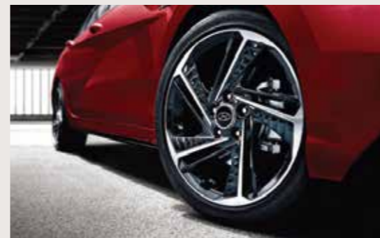
Vành hợp kim 18 inch