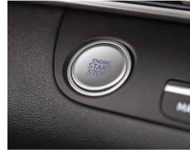
Khởi động bằng nút bấm