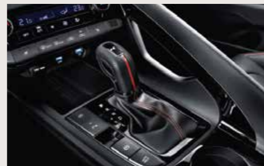
Cần số thể thao N Line