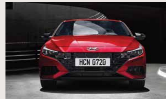
Cản trước với hốc hút gió lớn