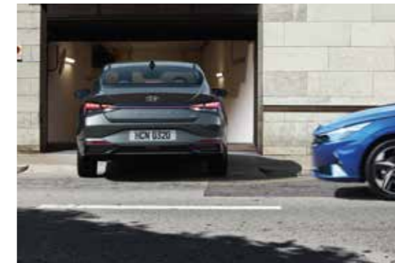
Cảm biến lùi