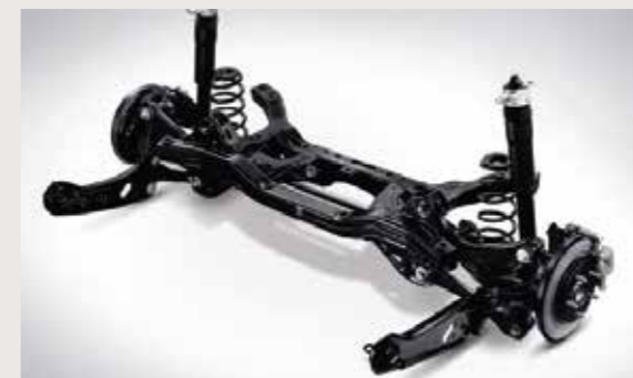
Hệ thống treo sau liên kết đa điểm